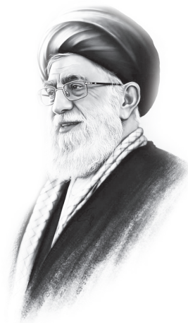
امام خامنه‌ای مد ظله العالی:

این فضای مجازی از فضای حقیقی زندگی ما چند برابر بزرگتر شده؛ بعضی‌ها اصلاً در فضای مجازی تنفس می‌کنند، زندگی‌شان در فضای مجازی است. جوانان هم سر و کار دارند با فضای مجازی با انواع و اقسام چیزها و کارها با برنامه‌های علمی اش یا مبادلات و امثال اینها سرو کار دارند، خب اینجا لغزشگاه است. هیچ کس نمی‌گوید آقا جاده نکش. اگر شما در منطقه‌ای جاده لازم دارید خیلی خوب، جاده بکش اتوبان هم بکش اما مواظب باش! آنجایی که ریزش کوه محتمل است، آنجا محاسبه لازم را بکنید ما به دستگاه‌های ارتباطی خودمان، به مجموعه وزارت ارتباطات و شورای عالی فضای مجازی که بنده از آن هم گله دارم، سفارشمان این است.